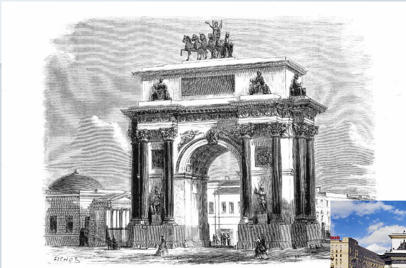
Триумфальные ворота у Тверской заставы в Москве. 1827—1834. Арх. О.И. Бове. Гравюра. Нач. 1880-х гг.